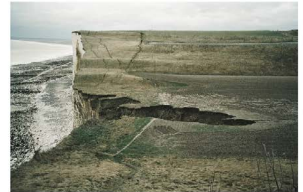
Les travailleurs de la mer, 2012 Courtesy Galerie Le Réverbère, Lyon