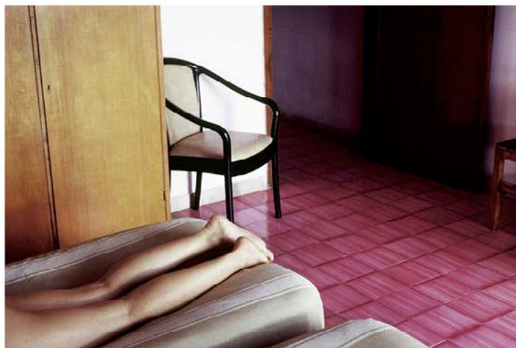
© Julien Magre. ELLES, extrait, 2017. Courtesy Galerie Le Réverbère, Lyon

Le Prix Niépce est attribué à Julien Magre, diplômé des Arts Décoratifs de Paris en 2000. Repéré en 2010 pour son projet Carollne, Histoire numéro 2 (Fillgranes, 2010), il photographie l'intimité de son quotidien avec instinct et poésie. Julien Magre est représenté par la galerie Le Réverbère à Lyon et fait également partie des lauréats de la grande commande photographique du ministère de la Culture, portée par la Bibliothèque nationale de France.