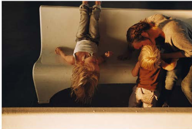
L'exposition « Silence ».

Jusqu'au 20 juillet, rendez-vous à la galerie Le Réverbère.